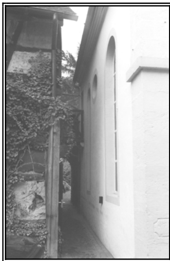
בית הכנסת במיכלשטט

ואכן מצאנו בהרבה מקומות שלא הקפידו על דין זה מפני הדוחק, כגון במיכלשטט שרק בכיוון דרום בית הכנסת המרחק בינו לבתים הוא יותר מח' אמות.