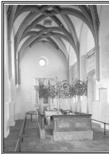
'מזרח פענסטער' בבית הכנסת 'פנחס שול' - פראג