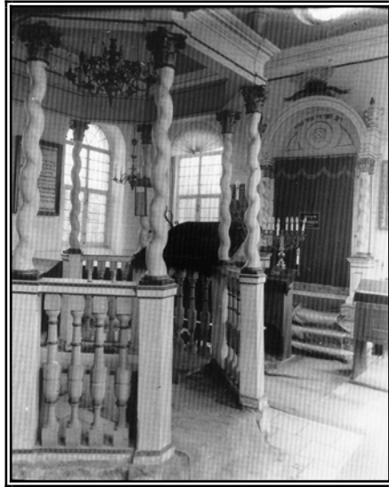
מבט לקיר מזרח של בית הכנסת בלויטרהאוזען (נבנה בשנת תקט"ו - 1755) בית כנסת טיפוסי באשכנז באותם ימים אלמימר (בימה) עם שמונה פינות וגג, הכיתוב 'דע לפני מי אתה עומד' במרום ארון הקודש סמוך לגג בוקע אור המזרח מבעד ה'מזרח פענסטער'